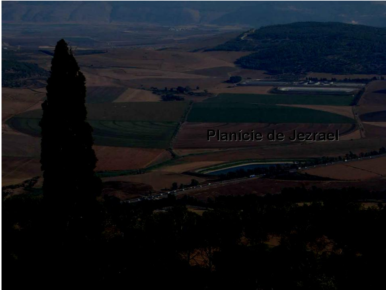
Planície de Jezrael